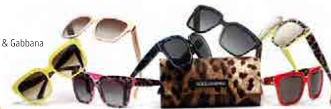
Dolce &amp; Gabbana