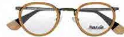
Rye &amp; Lye

Dozwolone kształty: owalne, kwadratowe, okrągłe, kocie... – to ewidentne inspiracje retro. Nie da się ich przegapić, zwłaszcza gdy występują w wersji „oversized”. Do modnych kształtów należy dodać takie elementy, jak nadal modne zwierzęce cętki, drewno plus skóra, lustrzane soczewki, trochę biżuteryjnych detali.