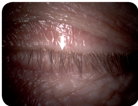
Ryc. 4. Łupież cylindryczny u podstawy rzęs (strzałka)

w mieszkach włosowych i gruczołach łojowych powiek może przyczynić się do nietolerancji soczewek kontaktowych, nawet wtedy, gdy pacjent nie skarży się na dolegliwości typowe dla demodekozy ocznej. Tłumaczy się to zwiększeniem stężenia białek we łzach oraz nasilonym tworzeniem osadów białkowo-lipidowych na powierzchni soczewki. To z kolei przyczynia się do nadmiernego parowania przedsoczewkowego filmu łzowego, co wywołuje dyskomfort i zniechęca użytkownika do korzystania z soczewek [3].