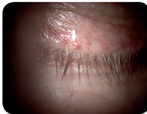
Ryc. 2. Poszerzona sieć naczyń skóry w sąsiedztwie brzegu powieki (strzałka)

Pacjenci z nużycą uskarżają się na świąd i pieczenie powiek, zaczerwienienie oczu, uczucie ciała obcego i łzawienie. Niekiedy symptomom tym towarzyszy światłowstręt i obniżenie ostrości wzroku. Objawy subiektywne nasilają się w nocy i nad ranem – w czasie największej aktywności roztoczy. Dysfunkcja gruczołów łojowych wynikająca z zasiedlenia gruczołów Meiboma przez nużeńce oraz odżywianie się przez roztocze ich wydzieliną, obniża jakość filmu łzowego i nasila jego parowanie z powierzchni oka. W efekcie prowadzi to do rozwoju zespołu suchego